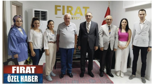
FIRAT ÖZEL HABER

Üniversitemiz de 2022 - 2023 eğitim öğretim yılında öğrenci sayımız 40 bin 500 civarındaydı. Bunlardan bir kısmı sağlık gereklilikleri veya diğer nedenlerden ötürü pasif duruma geçiyor aktif öğrenci sayısı 37 bin 361 civarında. Şimdi bu önumüzdeki eğitim ve öğretim döneminde biz yeni bölümlere öğrenci alıyoruz. Daha önce öğrenci almayan bölümlere YÖK kontenjan verdi. Bunları dikkate aldığımız da bu yıl 10 bin 506 öğrenci bekliyoruz. Bunun tamamının dolması beklenemez bu nedenle ortalama olarak 9 bin 500 ile 10 bin arası öğrenci bekliyoruz" diyerek sözlerini noktaladı.